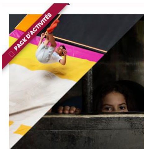
Pack Exaltant Trampo / Prison Island